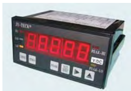
4-1/2 直流电压数字表头