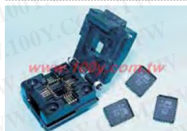
掀盖式 烧录IC转接座