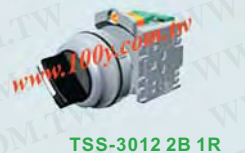
TSS-3012 2B 1R