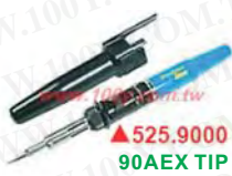
▲525.9000 90AEX TIP