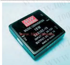
15W DC-DC Dual Output