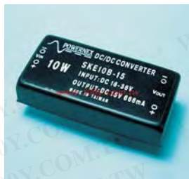
10W DC-DC Single and Dual output