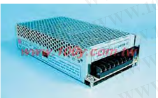
MW MEAN WELL