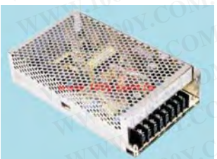
MW MEAN WELL