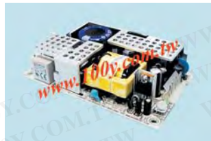
MW MEAN WELL RPT-65 Series