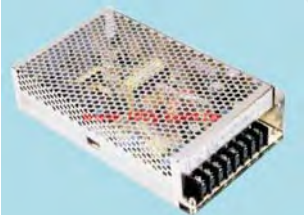
MW MEAN WELL T-120 Series