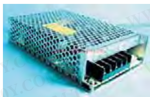
MW MEAN WELL NE Series