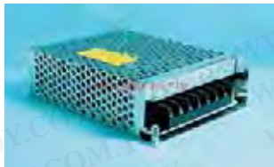
MW T-30 Series