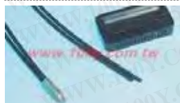
光纤光电开关-反射型