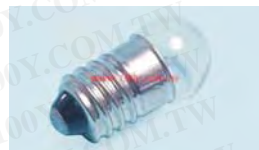
E10 3V-12V P13. 5S 3V-12V