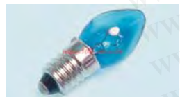
E101. 5V-12V, P13. 5S 1. 5V-12V BA9S 1. 5V-12V