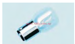
灯泡名称: 平头灯泡24V8W 尺寸: T16*35+-1MM 灯脚: BA15S 印字: 24V8W 钨丝形状: C-2V 电压: 24V 电流: 0.33A+-0.02A 流明: 80LM 光度: 6.4C.P