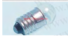
8038A 球径*全长 10*27 脚座(灯帽) E10 消耗电力 3.6W