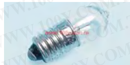
6VE10 E101. 5V-12V, P13. 5S 1. 5V-12V BA9S 1. 5V-12V