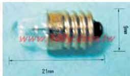
13244: 长度: 9mmx21mm