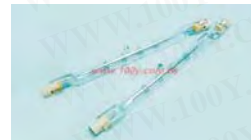
双头石英卤素灯管