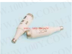
NDZ-E16-10A NDZ-E16-2A NDZ-E16-4A NDZ-E16-6A