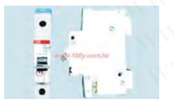
适用于: AC 50/60Hz 标准: GB10963