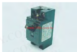
控制回路用保护器