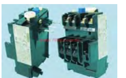
使用之热动过电流继电器