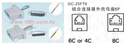
GC-25FT6 组合连接器外壳母座6P