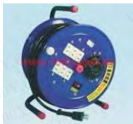
电缆轮座 Cord Drum TC-15A