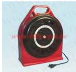
电缆轮座 Cord Drum TC-12B BS-100