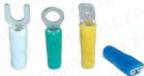
绝缘套管, 可搭配各式端子

材质: 采高级软质P. V. C. 制成。 用途: 适用于各种配电盘、机械中复杂配线之分色处理, 使线路能一目了然。软质弹性使能适合于各种不同形状的端子, 使用时着脱容易。 特点: 凯士士电机电子用高级绝缘套管、色泽清晰、光亮、弹性佳、绝缘性良好。