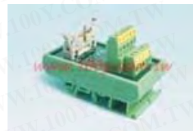
Hm10 Hm20 Hm34 Hm40 Hm50