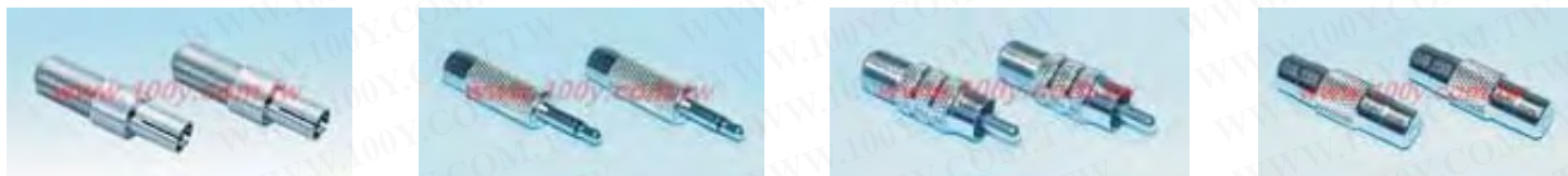
MCI-9002 MCI-7707 MCI-7706 MCI-7705