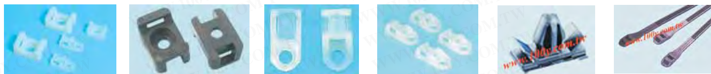
HC-0 HC-0L HC-1 HC-2 HC-2S HC-1-B TH-1 TH-1 PHC-5 PHC-4 DL-265

扎线固定座 材质: UL合格之NYLON 66 (本色), 防火等级94V-2 用途: 配合螺丝, 固定电线电缆; 电机、电子、冷气配线之固定用。