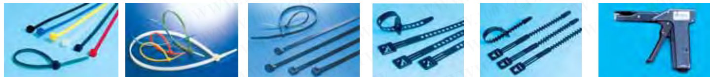
CV-060B YJ-80(B) CV-075 CV-292B CV-200MB CV-100YW CV-150B PCT-140B WL-160B TG-1 CV-120L CV-300B 1326 CV-100RD CV-250MB CV-100B CV-100 CV-200 CV-100KRD