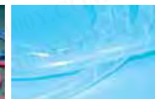
SWB-12 SW-20 SWB-9 SWB-16 SWB-6