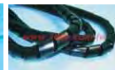
KS-24BK KS-8BK KS-10BK KS-12BK KS-12 KS-19BK