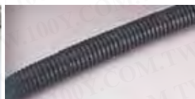
CR-1007P CR-1015PCR-1028P CR-1013P CR-1022P