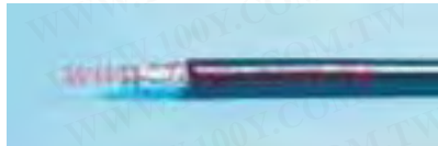
RG-6/U Belden 9116 RG-59/U Belden 9104