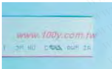
C3365/10 C3365/26 C3365/34 C3365/40 C3365/50 C3365/64