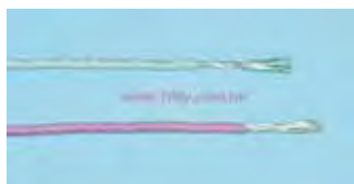
UL3239-22AWG-W UL3239-22AWG-K UL3239-22AWG-R UL3239-22AWG-W UL3239-22AWG-W- 门市商品