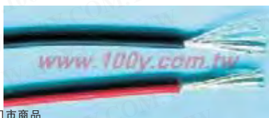
UL3239-22AWG-20KV-B UL3239-22AWG-20KV-R UL3239-22AWG-10KV-R UL3239-22AWG-10KV-B