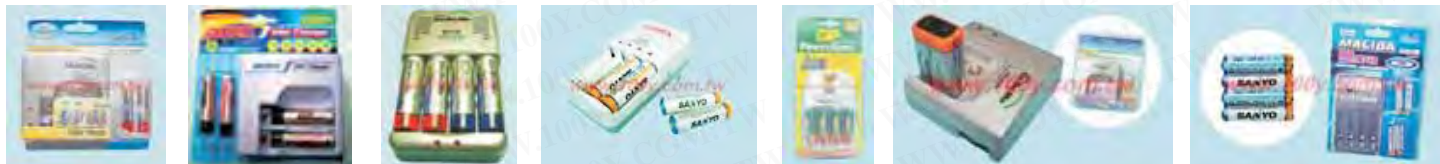
DCC-204H Hh184 Hh183 G-AXE MPB-935 DCC-929G JCHSC-108-800