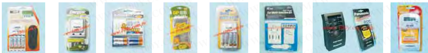
YF-4023 Hh210 N-M57S GPPB19US Hh208 CHB-10D Hh198 Pw6178