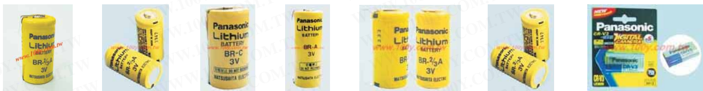
PANASONIC_BR-2/3A PANASONIC_BR-2/3AH PANASONIC-BR-C PANASONIC-BR-A PANASONIC-BR-2/3AE5P PANASONIC_BR-2/3A CR-V3/T1B

锂离子电池柱式电池 Li/MnO2电池特性 单体电压高:工作电压2.8-3.2V; 高比能量:电池的比能量高达330wh/kg和750wh/dm3; 高容量、低内阻、性能稳定, 放电电压平稳,且无电压滞后现象,可提供大电流放电; 贮存期长:电池自放电小、年容降率低于3%,采用全密封结构, 电池在常温下可储存6-10年; 使用温度范围宽:-40-70℃使用; 安全性好,可靠性高,无公害,属绿色电源.