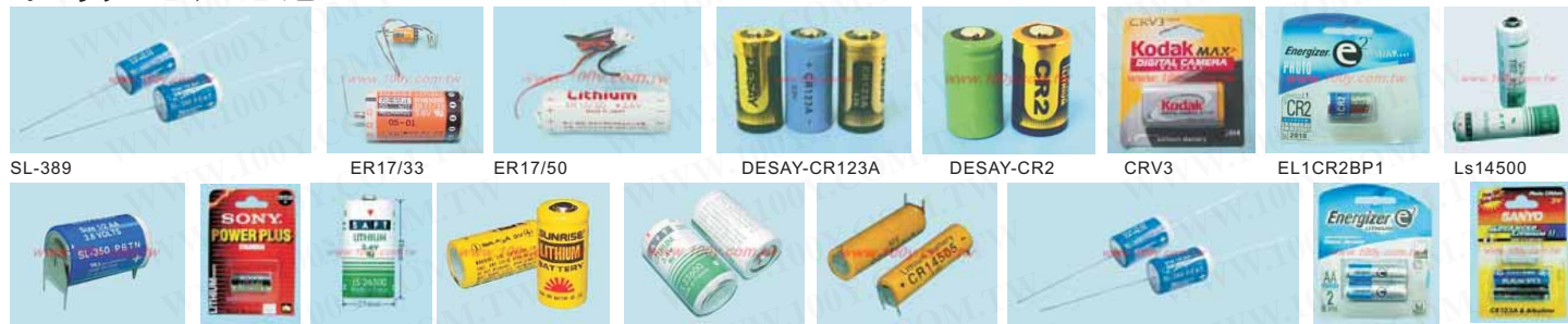
SL-389 ER17/33 ER17/50 DESAY-CR123A DESAY-CR2 CRV3 EL1CR2BP1 Ls14500 SL350PT SONY-CR123A Ls26500 SUNRISE-BR-2/3A Ls33600 Cr14505 SL-350P L91 SANYO-CR123A-1BP(N2)