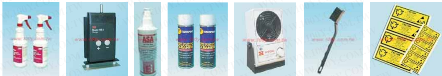
3M-8001 AR718A ASA D1743-6S XAXY001U 防静电刷 防静电贴纸130*50 防静电贴纸65*25